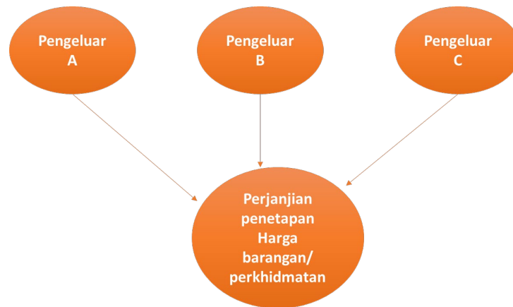
Rajah 1. Perjanjian Mendatar

Perjanjian menegak pula merangkumi perjanjian antara perusahaan yang setiapnya beroperasi pada peringkat yang sama dalam rangkaian pengeluaran atau pengedaran. 2 Antara amalan anti persaingan yang dilakukan melalui perjanjian menegak adalah suatu amalan yang dikenali sebagai resale price maintenance ('RPM'). RPM melibatkan penetapan harga minimum atau tetap oleh pengeluar kepada pengedarnya yang mana pengedar tersebut hendaklah menjual barangan tersebut pada harga yang ditetapkan oleh pengeluar tersebut. Rajah 2 di bawah memberi gambaran ringkas berkenaan perjanjian menegak yang mengamalkan RPM 3 .