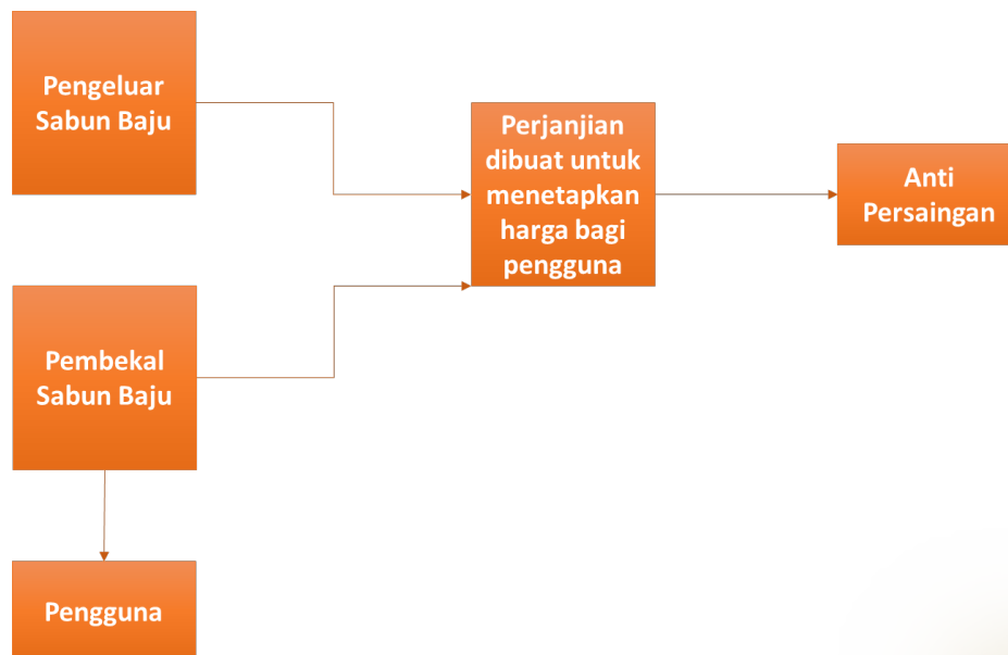
Rajah 2. Perjanjian Menegak

Perjanjian menegak pula merangkumi perjanjian antara perusahaan yang setiapnya beroperasi pada peringkat yang sama dalam rangkaian pengeluaran atau pengedaran. 2 Antara amalan anti persaingan yang dilakukan melalui perjanjian menegak adalah suatu amalan yang dikenali sebagai resale price maintenance ('RPM'). RPM melibatkan penetapan harga minimum atau tetap oleh pengeluar kepada pengedarnya yang mana pengedar tersebut hendaklah menjual barangan tersebut pada harga yang ditetapkan oleh pengeluar tersebut. Rajah 2 di bawah memberi gambaran ringkas berkenaan perjanjian menegak yang mengamalkan RPM 3 .